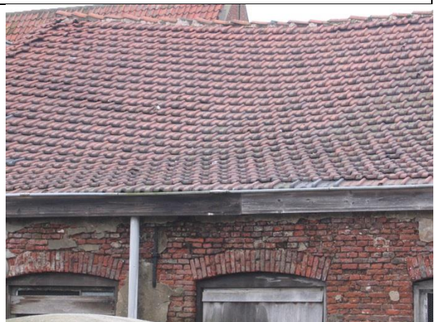
Zichtbare constructieve gebreken (vervorming van de dakconstructie).