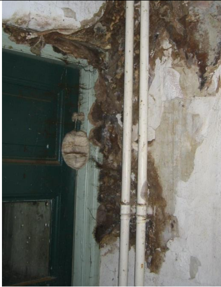
De aanwezigheid van schimmels en zwammen die gevaarlijk zijn voor houtconstructies.