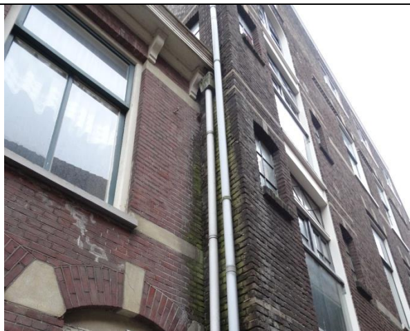
Het niet wind- en waterdicht houden van het gebouw (niet functionerende hemelwaterafvoer).