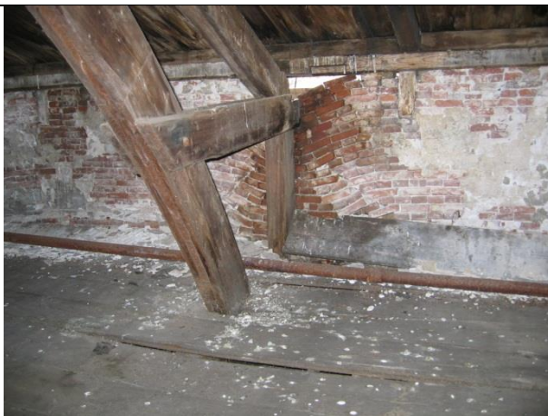
Zichtbare constructieve gebreken (uitbuikende gevel).