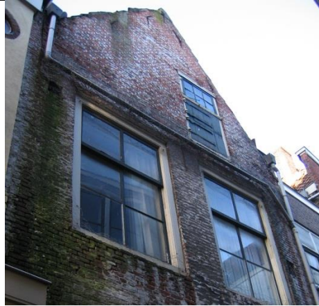
Het niet wind- en waterdicht houden van het gebouw (niet functionerende hemelwaterafvoer).