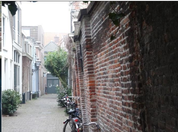
Zichtbare constructieve gebreken (uitbuikende gevel).