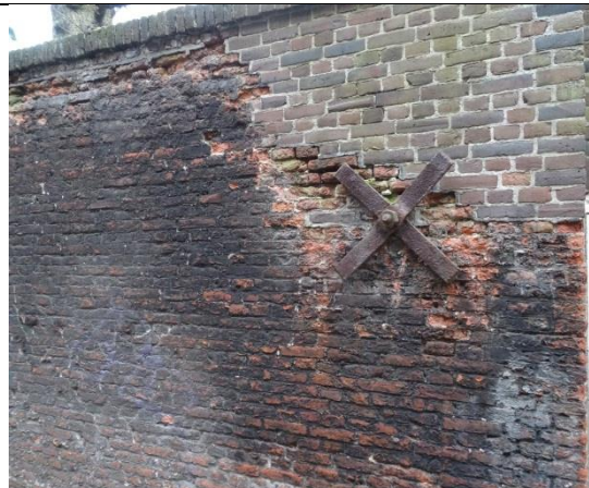
De aanwezigheid van roestend ijzerwerk in de gevel (gevel anker) én inwaterende gevel (ontbrekende voegen en steenkanker).