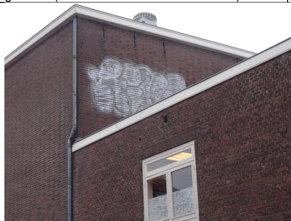
Ontsieren gevel (graffiti).