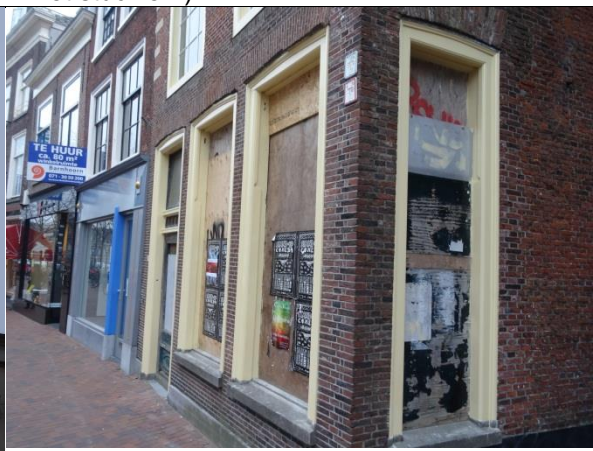
Ontsierende gevel (dichttimmeren van ramen).