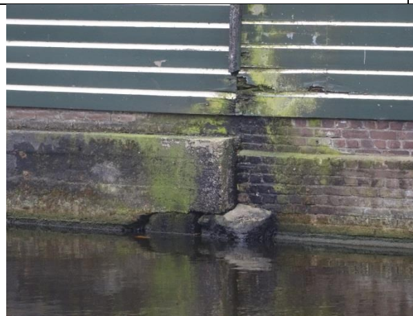
Het niet wind- en waterdicht houden van het gebouw (niet functionerende hemelwaterafvoer).