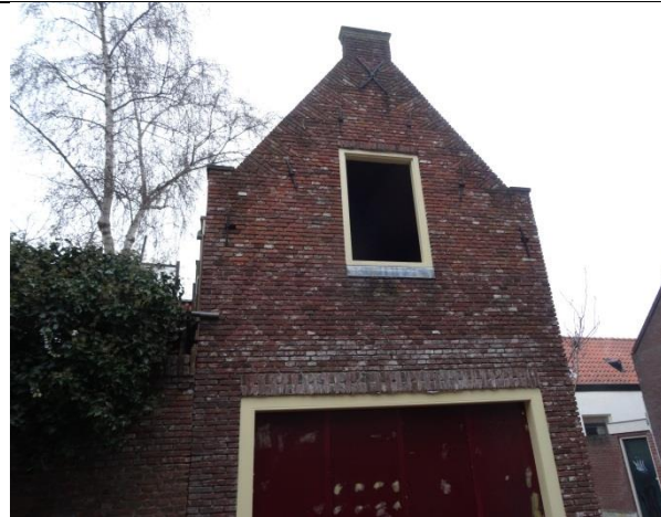
Het niet wind- en waterdicht houden van het gebouw (ontbreken van een raam of luik).