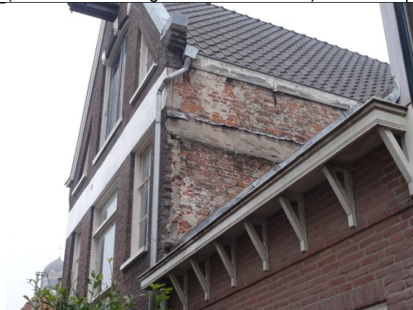
Inwaterende gevel (ontbreken stucwerk).