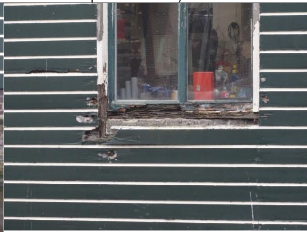
Aantasting van ramen, deuren en kozijnen (ontbrekende verflagen en houtaantasting).