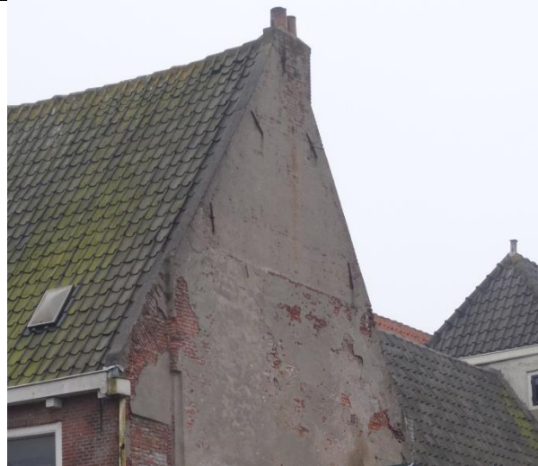
Inwaterende gevel (ontbreken stucwerk).