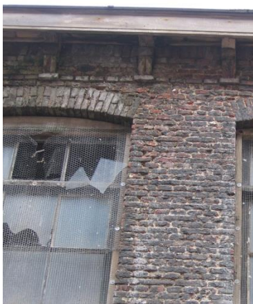
Inwaterende gevel (ontbrekende voegen).