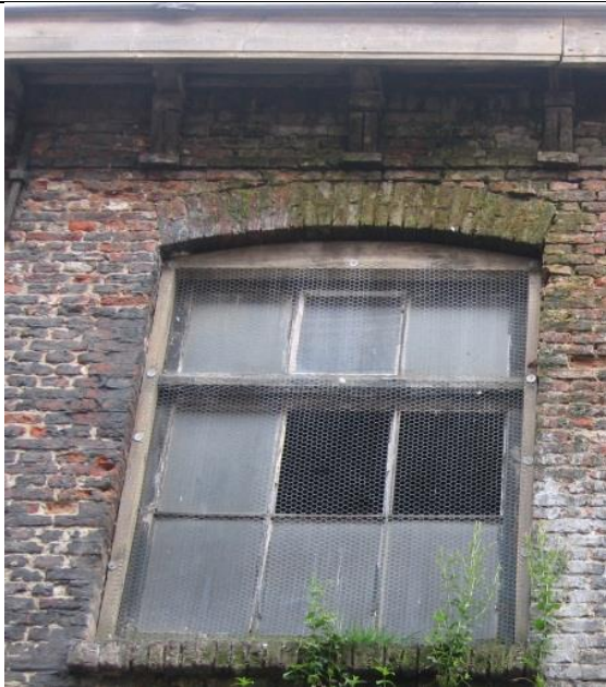
Het niet wind- en waterdicht houden van het gebouw (niet functionerende goot).