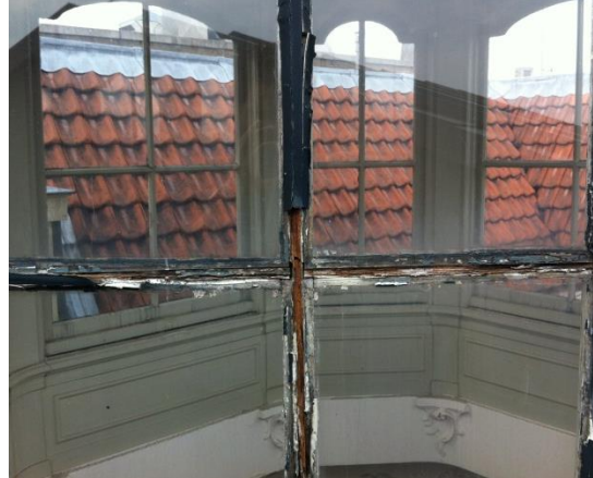
Zichtbare houtaantasting op meerdere plaatsen van het buitenhoutwerk (verrotte ramen).