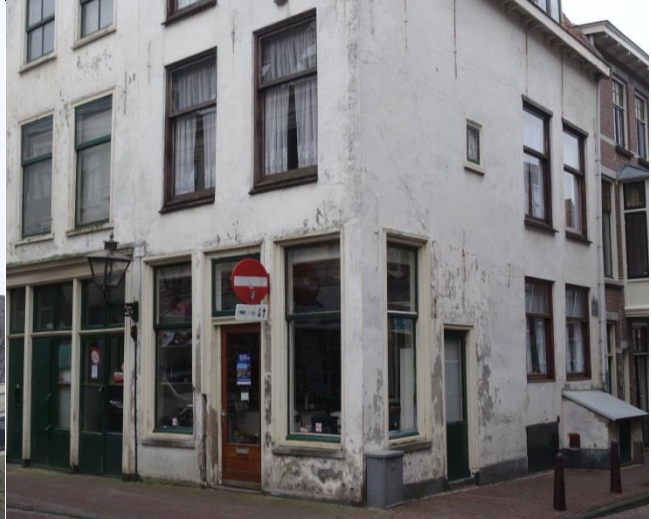
Ontsieren gevel (grotendeels ontbreken schilderwerk op het stucwerk).