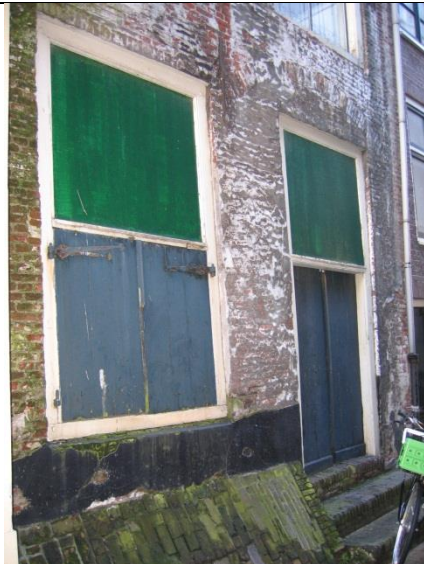
Loszittende elementen in of aan de gevel (luiken) en ontsieren gevel (dichtschilderen van ramen).