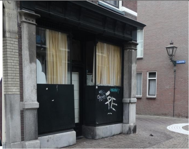
Ontsieren gevel (dichttimmeren van ramen).