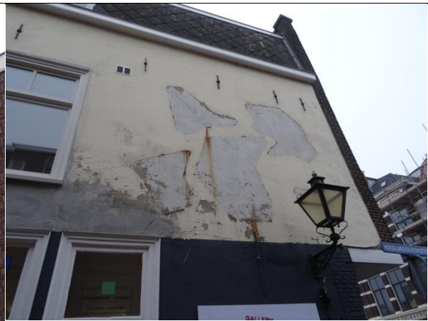
Ontsieren gevel (grotendeels ontbreken schilderwerk op het stukwerk).