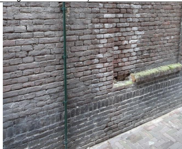
Inwaterende gevel (ontbrekende voegen en ontbreken waterslag).