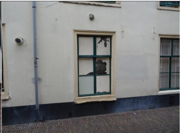
Ontsiereren gevel (dichtplakken van ramen).