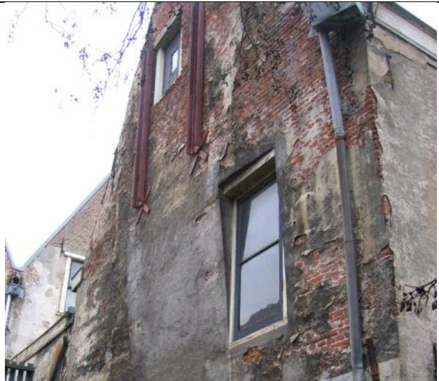
Zichtbare constructieve gebreken (uitbuikende gevel).