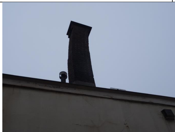
Zichtbare constructieve gebreken (scheef hangende schoorsteen).