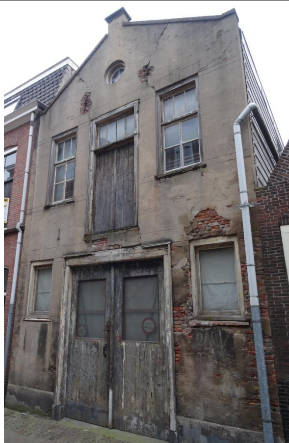
Inwaterende gevel (ontbreken stucwerk) én aantasting van ramen, deuren en kozijnen (ontbrekende verflagen en houtaantasting).