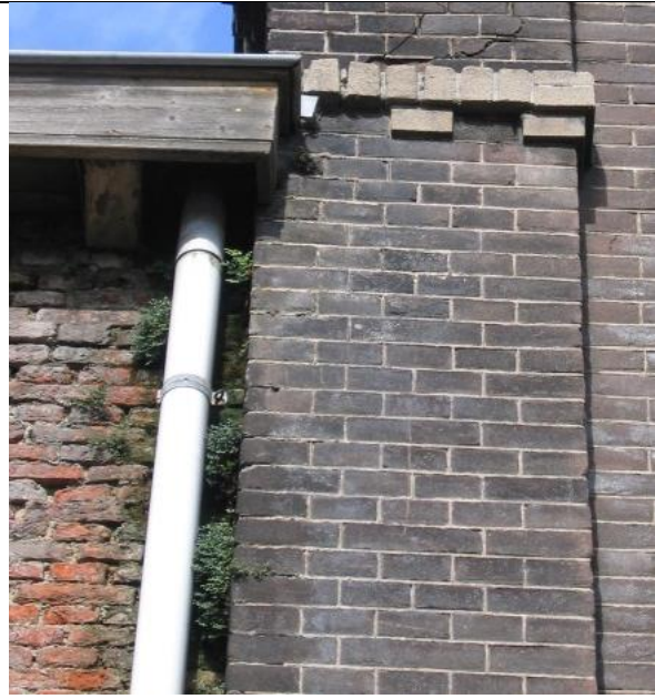
De aanwezigheid van begroeiing tegen de gevel als gevolg van een niet functionerende goot.