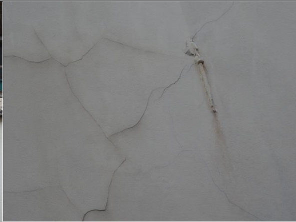
De aanwezigheid van roestend ijzerwerk in de gevel (gevel anker) én inwaterende gevel (scheuren in het stucwerk).