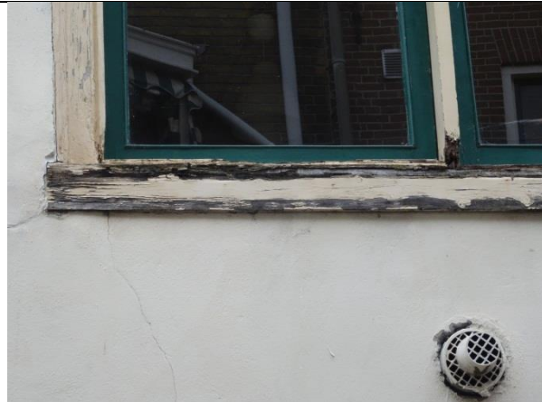
Aantasting van ramen, deuren en kozijnen (ontbrekende verflagen en houtaantasting).